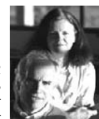
DAS EHEPAAR KRIS UND DOUGLAS TOMPKINS Amerikanische Umweltschützer und Öko-Unternehmer

In den Parks von Kris und Douglas Tompkins finden bedrohte Tier- und Pflanzenarten aus Südamerika Zuflucht. Neben dem nachhaltigen Tourismus tragen der Verkauf von Lebensmitteln und Strickwaren aus den angrenzenden Biofarmen zur Finanzierung der Schutzgebiete bei und bieten gleichzeitig Arbeitsplätze für die einheimische Bevölkerung.