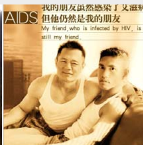
“My friend, who is infected by HIV, is still my friend.”