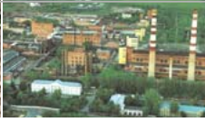
Wenn Tolstoi mit den Fabrikanten : Jörg Rathmann