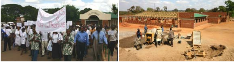
Bild links: Das Personal des Lighthouse beim „Big Walk“ anlässlich des Welt-AIDS-Tages 2005. Bild rechts: Bauarbeiten am Martin-Preuss-Center, das Ende 2006 fertiggestellt sein soll.