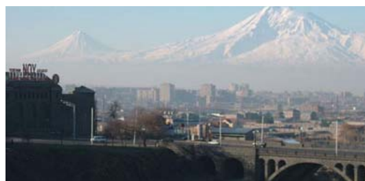
Armenien, das kleine Land in Vorderasien, ist nicht größer als das deutsche Bundesland Brandenburg. CIM unterstützt es vor allem beim Aufbau moderner Wirtschafts- und Verwaltungsstrukturen.

Ein besonderes Anliegen der Reise war eine intensivere Vernetzung der CIM-Aktivitäten mit den GTZ-Programmen in den jeweiligen Ländern. In allen Ländern fanden Treffen mit den CIM-Fachkräften und GTZ-Mitarbeitern vor Ort statt. Die bisher noch kleinen CIM-Programme sollen vor allem in Aserbaidtschan und Armenien ausgebaut werden – so ein Ergebnis der Reise. Auch in Georgien werden bis zum Jahresende weitere vier CIM-Experten ihre Arbeit aufgenommen haben. Bei einem Zwischenstopp in Wien gab es außerdem ein Gespräch mit der österreichischen Entwicklungsgesellschaft ADA, bei dem es um Möglichkeiten der Zusammenarbeit ging.