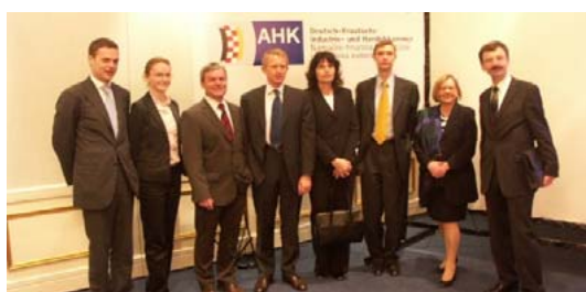
Podiumsteilnehmer der gemeinsamen Veranstaltung der Deutsch-Kroatischen Industrie- und Handelskammer und der Österreichischen Außenhandelsstelle in Zagreb.