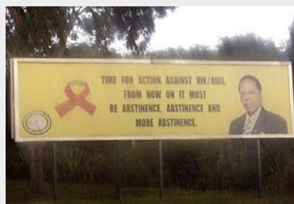
“Time for action against HIV/Aids. From now on it must be abstinence, abstinence and more abstinence.”

Andere Länder, andere Sitten, andere Kampagnen zum Schutz gegen HIV/Aids: gesehen in Malawi, China und Deutschland.