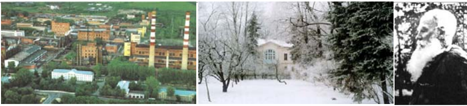
In unmittelbarer Nachbarschaft: das Chemiekombinat „Schtschekino-Asot“ und das Leo Tolstoi Museum im russischen Jasnaja Poljana. Der Schriftsteller Lew Nikolajewitsch Graf Tolstoi wurde 1828 in Jasnaja Poljana geboren. Das Bild zeigt ihn auf seinem Anwesen im Jahr 1908.